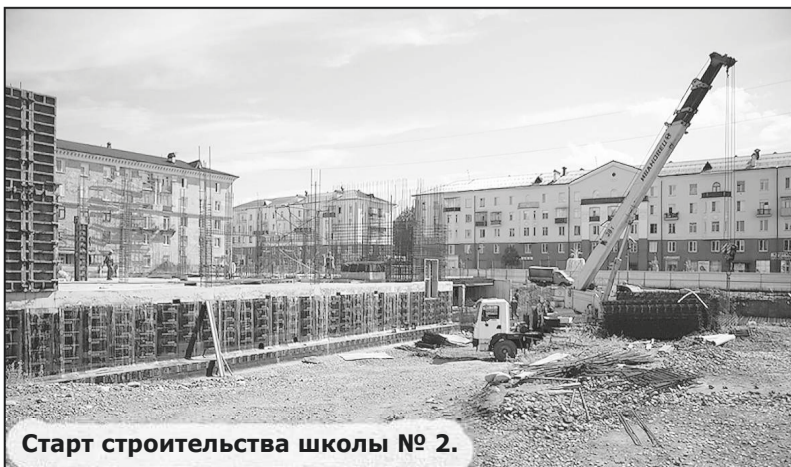
Старт строительства школы № 2.