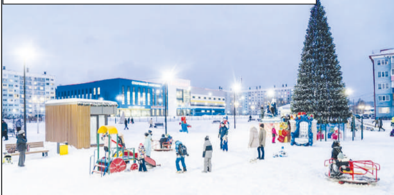
За порядком следят с помощью видеочкамер.

благодарность студентам за отзывчивость и участие в благом и очень важном деле.