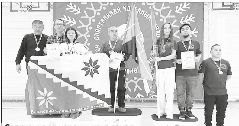
Спартакиада коренных народов.