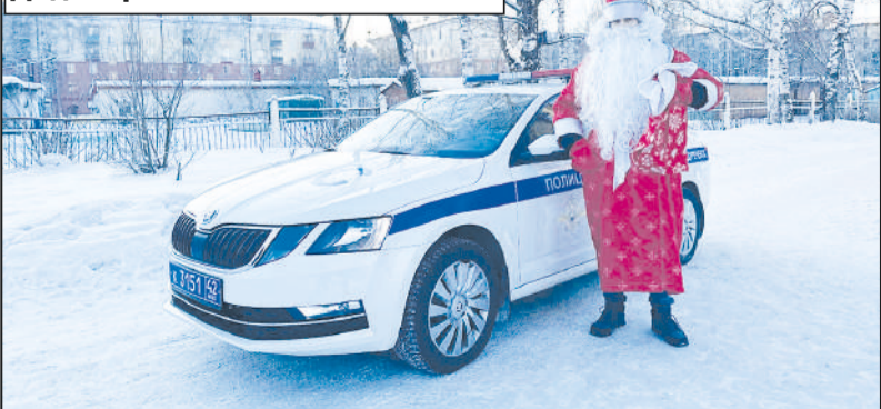
Дед Мороз - за безопасность.

Софья ЖУРАВЛЕВА. Снимки предоставлены СК «Звёздный», МГСТ.