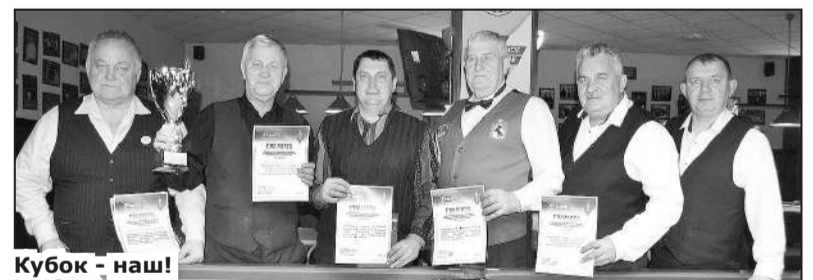
Кубок - наш!

Круглосуточно работает телефонный информатор: 19-650. РАБОТАЕТ «ТЕЛЕФОН ДОВЕРИЯ» по вопросам, связанным с проявлениями коррупции. ТЕЛЕФОН: 8 (384-75) 4-84-04.