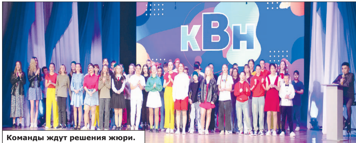
Команды ждут решения жюри.

сыграло на привычном уже парадоксе: brutальные девочки в рокерских кожанках и субтильные мальчики, которые бьют интеллектом. «Да я одно слово про тебя скажу – никто вообще с тобой разговаривать не будет!» – «Это какое же?» – «Ротавирус!». Запомнился и «поппинг» – танец, который можно осваивать не в студии, а на маршруте автобуса 101.