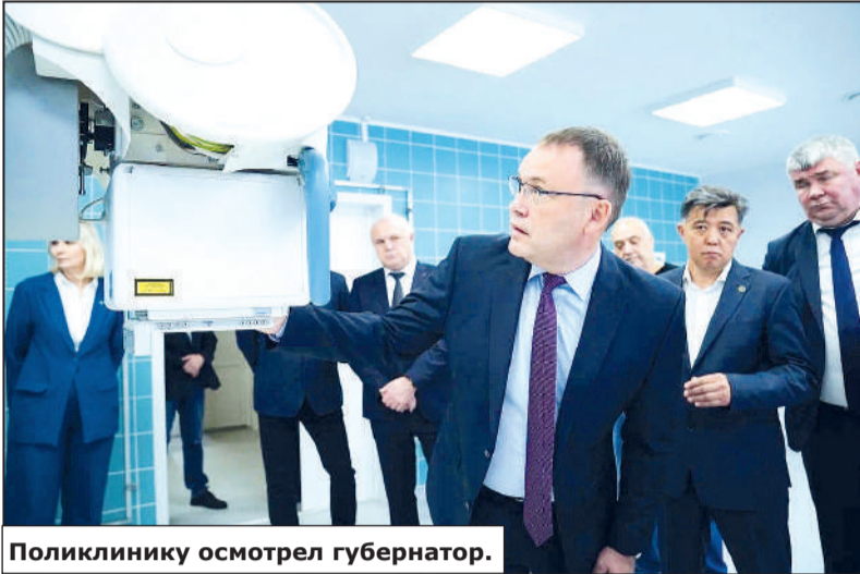
Поликлинику осмотрел губернатор.