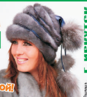
Реклама. Г. ИРКУТСК

Акция! Меняем старую шапку на новую с доплатой!