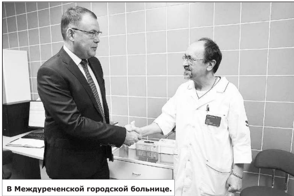
В Междуреченской городской больнице.