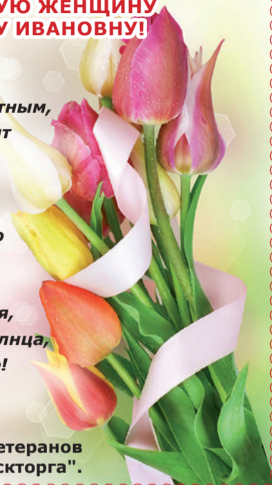
Совет ветеранов "Междуреченскторга".

Пусть каждый день ваш будет счастливым и радостным, Пусть в дом к вам приходит благодать и удача, Пусть близкие вас крепко любят и ценят, Пусть в жизни будет много праздников и памятных событий. Желаем крепкого здоровья, хорошего настроения и солнца, как за окном, так и в душе!