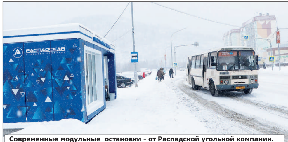
Современные модульные остановки - от Распадской угольной компании.