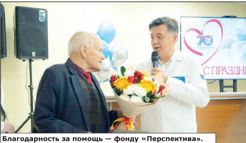
Благодарность за помощь — фонду «Перспектива».