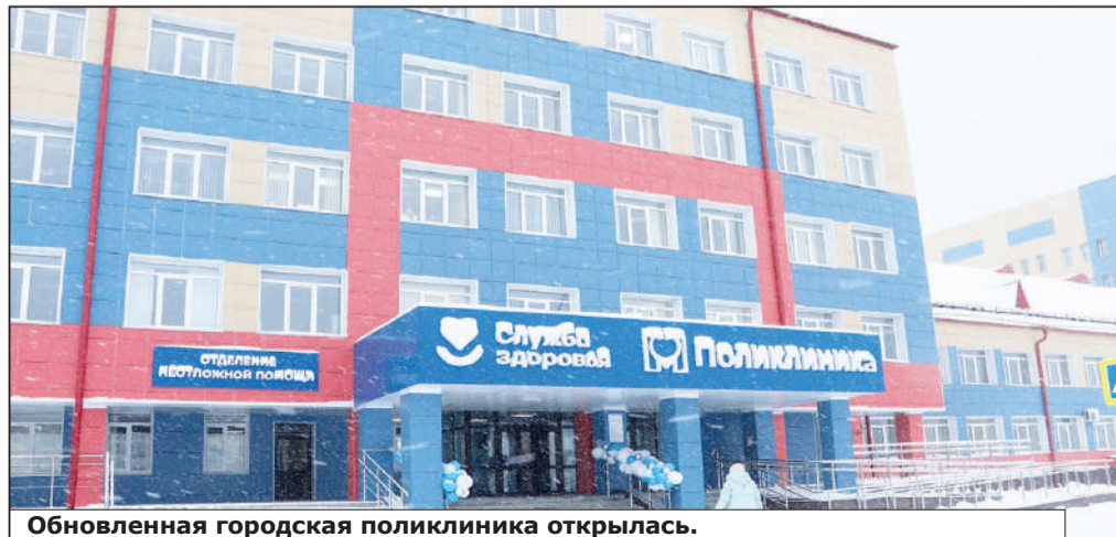
Обновленная городская поликлиника открылась.