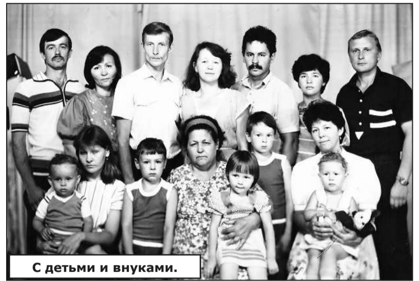
С детьми и внуками.