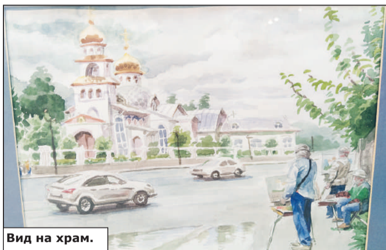
Вид на храм.