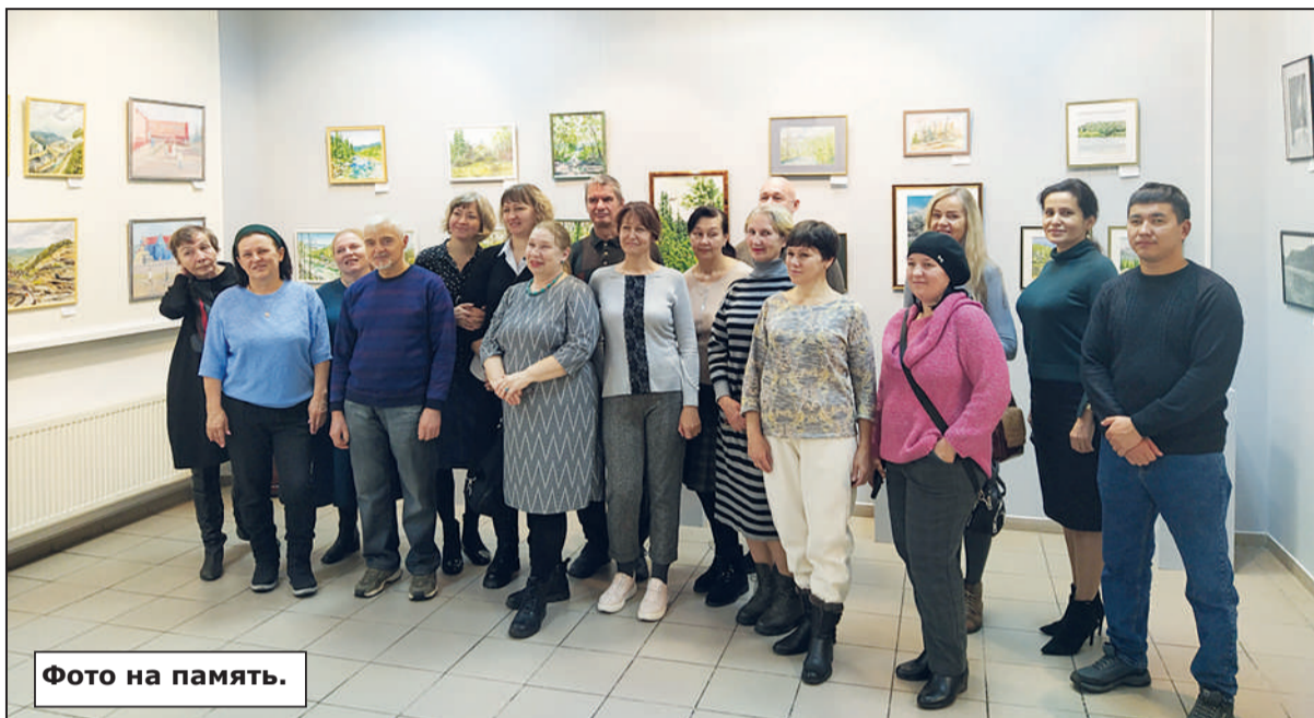
Фото на память.

Сборная выставка живописи и графики «Пленэры» ждёт посетителей в городском выставочном зале. Всё разнообразие арсенала средств - работы маслом, акрилом, акварелью, соусом и сангиной, мастерское владение техникой пастели - отражает индивидуальный почерк каждого автора. В пленэрных зарисовках художники «схватывают» главное и достигают максимума выразительности.