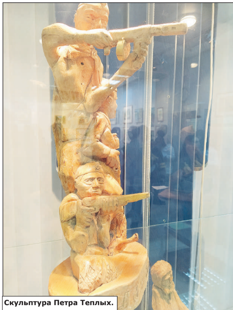
Скульптура Петра Теплых.