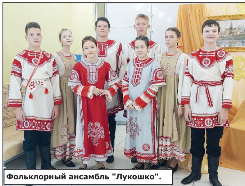
Фольклорный ансамбль "Лукошко".

Осень - традиционное время начала нового музыкального, театрального сезона. И в столице России проходит фестиваль с говорящим названием «Видеть музыку» - масштабный смотр музыкальной сцены страны. В нашем городе возможность видеть и узнавать классические жанры музыки для населения и в первую очередь - для подрастающего поколения создают коллективы детских музыкальной и хоровой школ, проводя серии филармонических концертов.