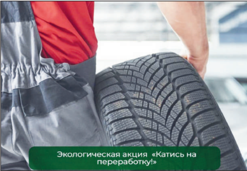
Экологическая акция «Катись на переработку!»