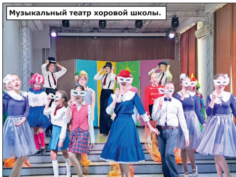
Музыкальный театр хоровой школы.

Высокий ценз учреждений в сфере музыкального образования не допускает характерных проблем современной детской филармонии, когда стрем-