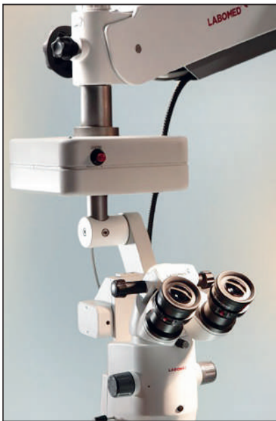
Микроскоп PRIMA Labomed.

Подготовила Софья ЖУРАВЛЁВА. С использованием материалов и фото пресс-службы Междуреченской городской больницы.