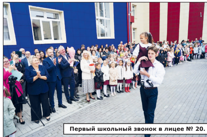
Первый школьный звонок в лицее № 20.

Не забывайте, что у нашей школы есть красивое, достой-