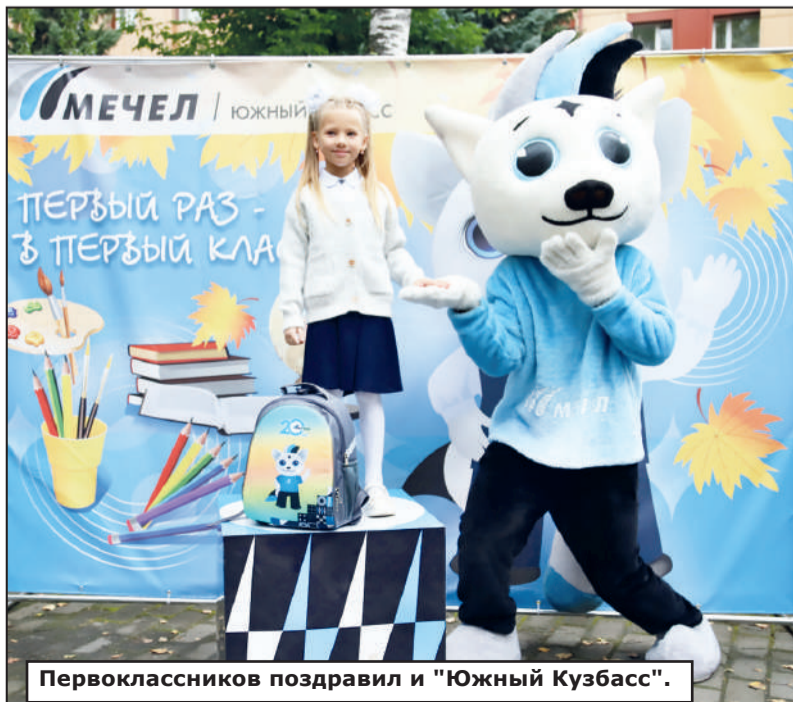
Первоклассников поздравил и «Южный Кузбасс».