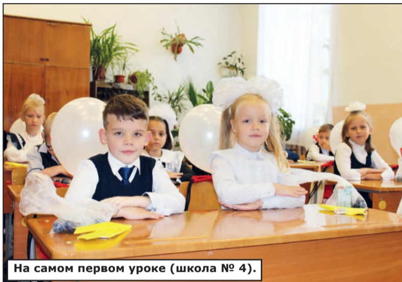
На самом первом уроке (школа № 4).

Желаю педагогам профессиональных успехов, мудрости, ученикам – трудолюбия, настойчивости в достижении