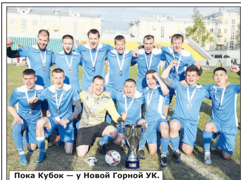
Пока Кубок — у Новой Горной УК.

Информация и снимки предоставлены управлением по связям с общественностью Распадской угольной компании.