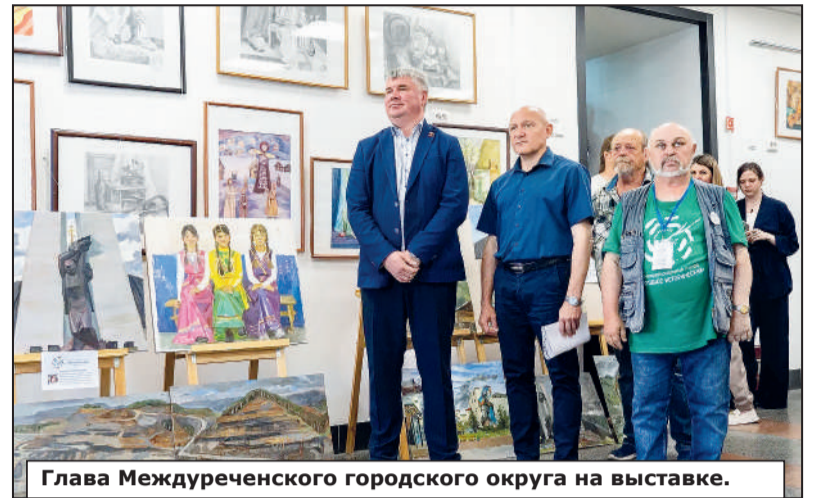
Глава Междуреченского городского округа на выставке.

Перед самым отъездом мэтров изобразительного искусства пленэрные работы были выставлены в стенах детской художественной школы №6, где состоялся и круглый стол – профессионалы обсудили вопросы