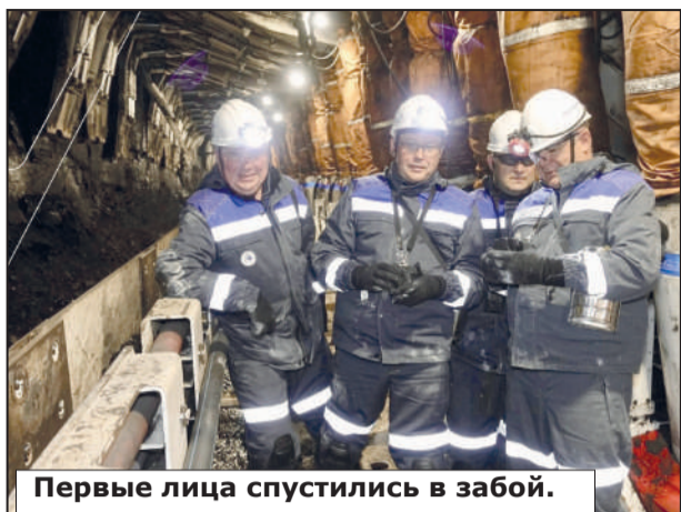
Первые лица спустились в забой.