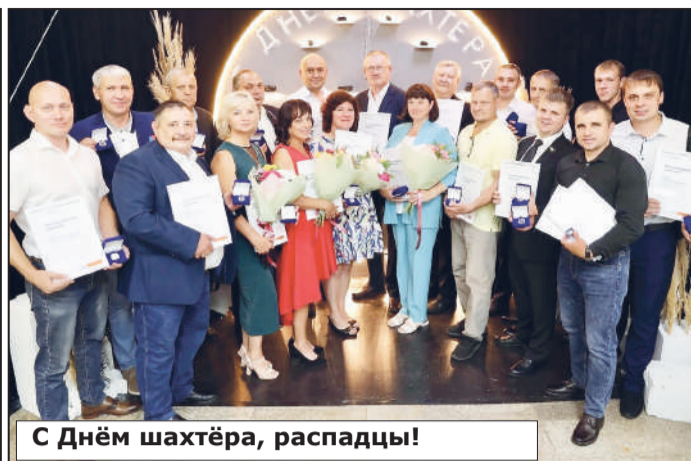
С Днём шахтёра, распадцы!