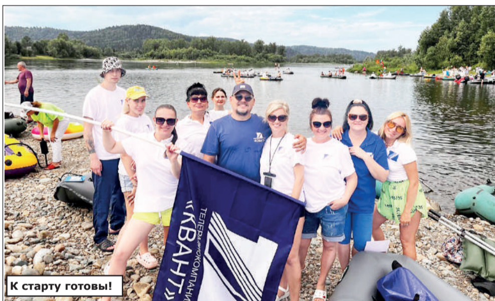
К старту готовы!