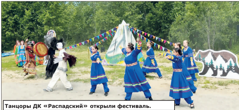
Танцоры ДК «Распадский» открыли фестиваль.

Водный этнофестиваль «Легенды Томусы» собрал в минувшую субботу на старте возле понтонной переправы посёлка Майзас 67 зарегистрированных плавательных средств и 189 участников из Междуреченска, Мысков, Осинников, Новокузнецка, Кемерова, Новосибирска и даже Владивостока.