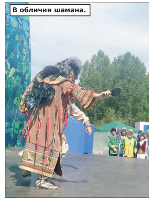
В обличи шамана.