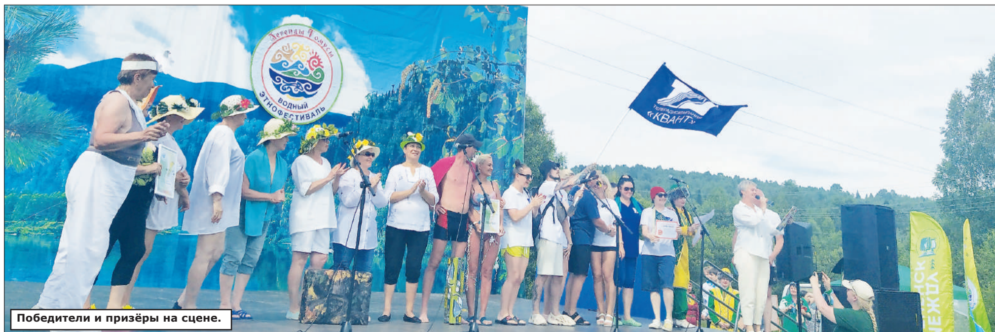
Победители и призёры на сцене.

Софья ЖУРАВЛЁВА. Фото автора и МАУ СМИ «КВАНТ».