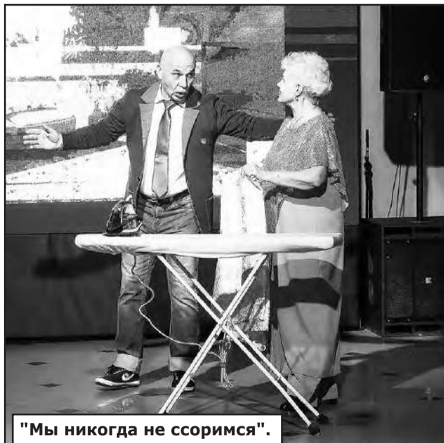
"Мы никогда не ссоримся".