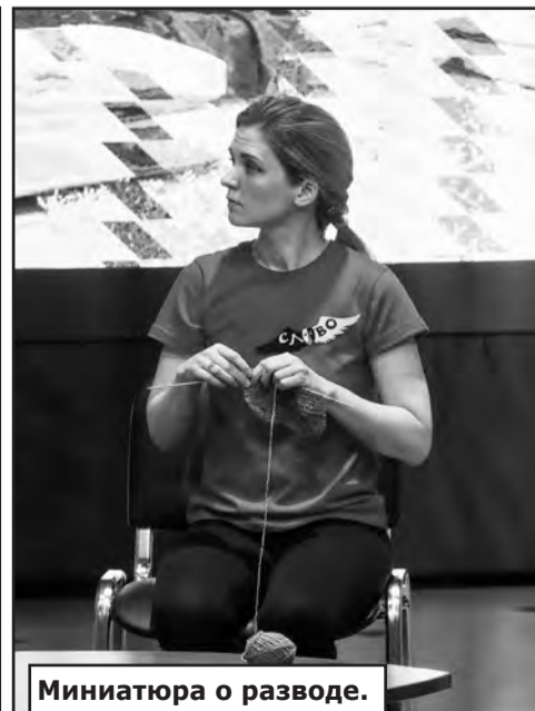
Миниатюра о разводе.