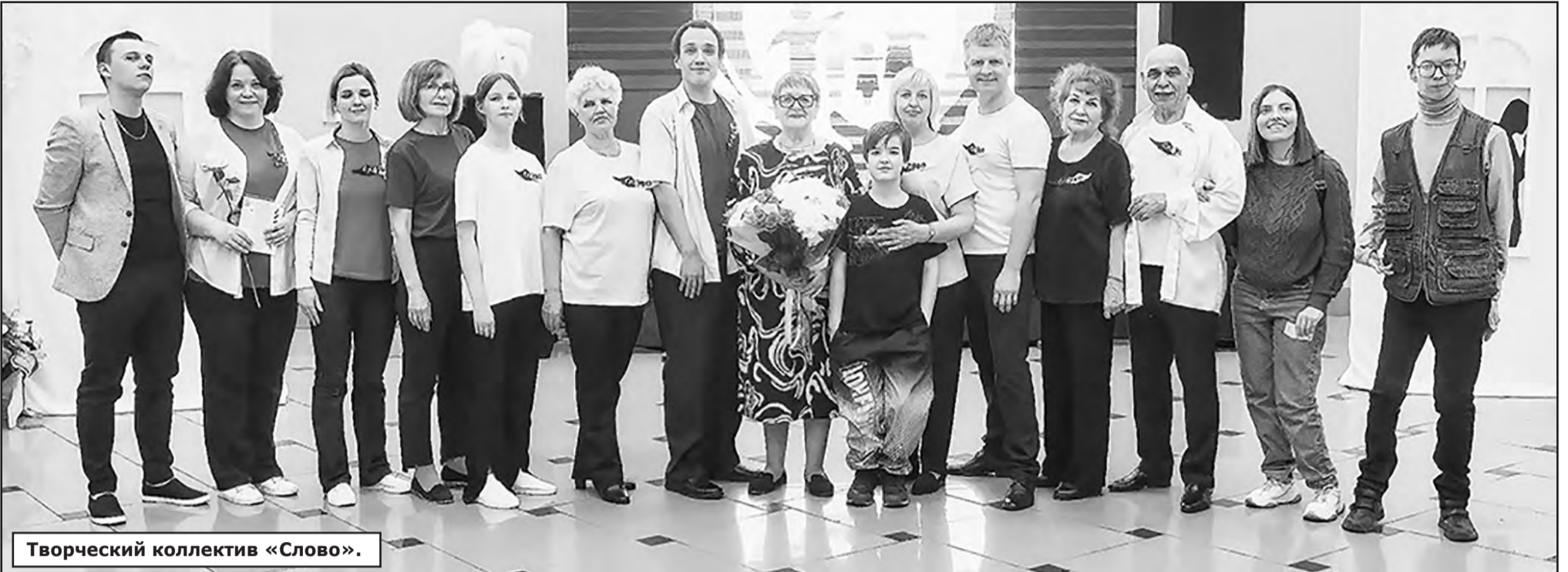
Творческий коллектив «Слово».