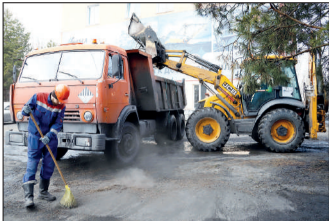
Работники угольных компаний не отставали: наводили глянец вокруг административных и производственных зданий.

Софья ЖУРАВЛЁВА.