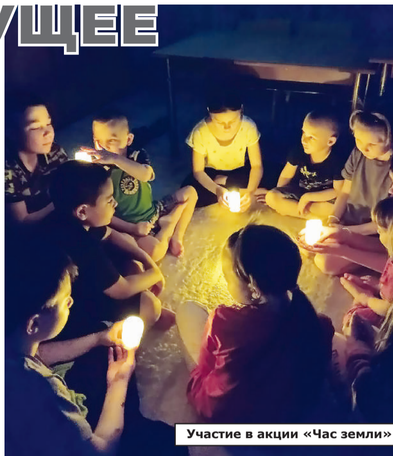
Участие в акции «Час земли»

Сотрудники стараются, чтобы реабилитационная среда была привлекательна для подростков; этому способствует участие в грантовых конкурсах и привлечение средств меценатов. За последние три года разработки коллектива получили поддержку производителей – Распадской угольной компании, Новой Горной УК, СДС-Энерго, муниципальной управляющей компании; Сбербанк помогал приобретать оборудование для проведения мероприятий. Одной из крупных побед стала реализация высокотехно-