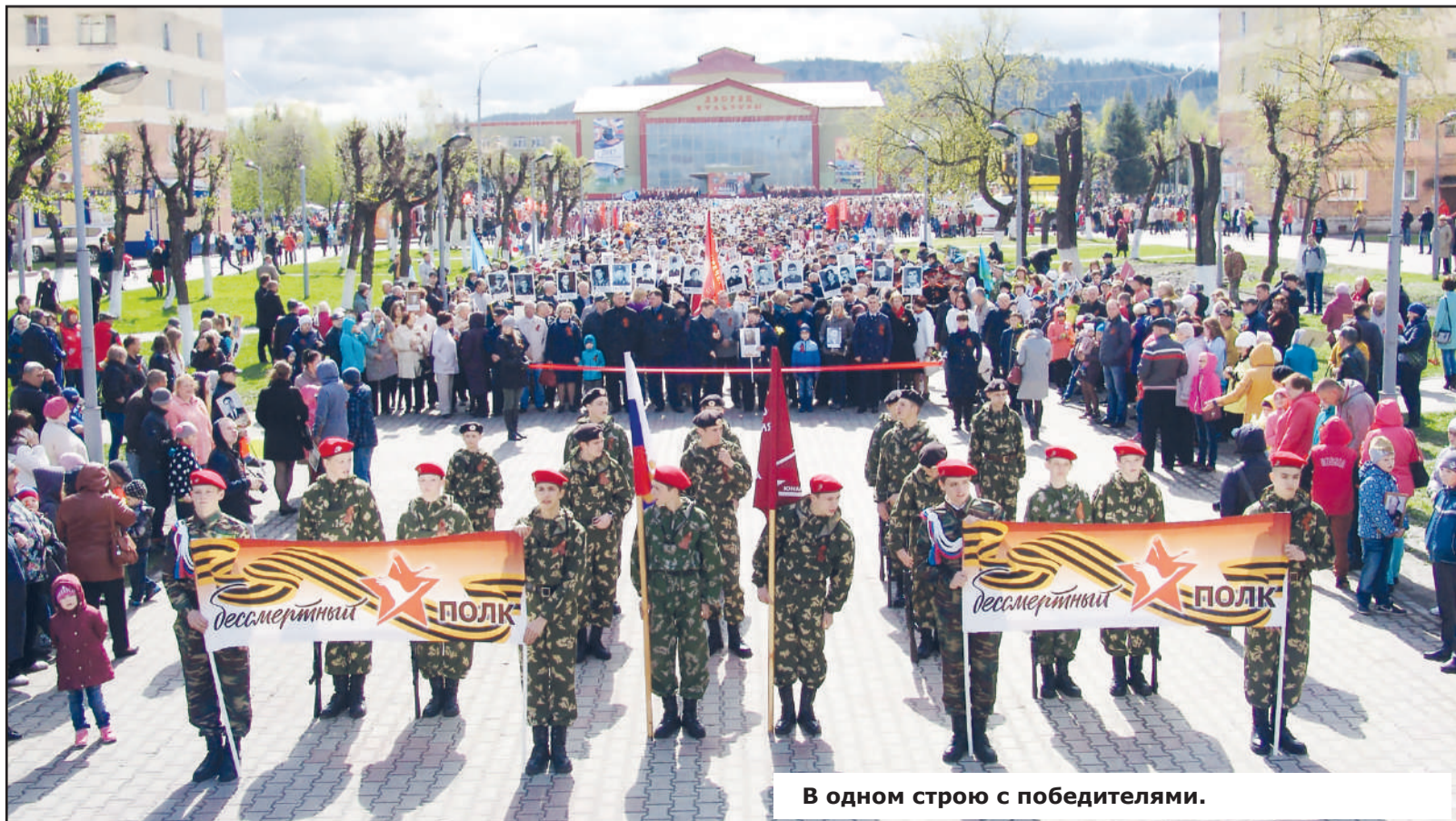
В одном строю с победителями.