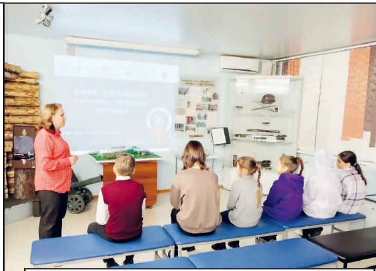
«Час космонавтики» для несовершеннолетних в музее воинской Славы.