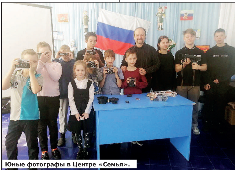
Юные фотографы в Центре «Семья».

Plus вся советская фотохимическая лаборатория, необходимая для проявления плёнки и производства фотографий, включая фотоувеличитель, красный фонарь, резак для фотобумаги, кюветы для проявления, закрепления, промывания фотографий, дальше шли сушка и глянцевание.