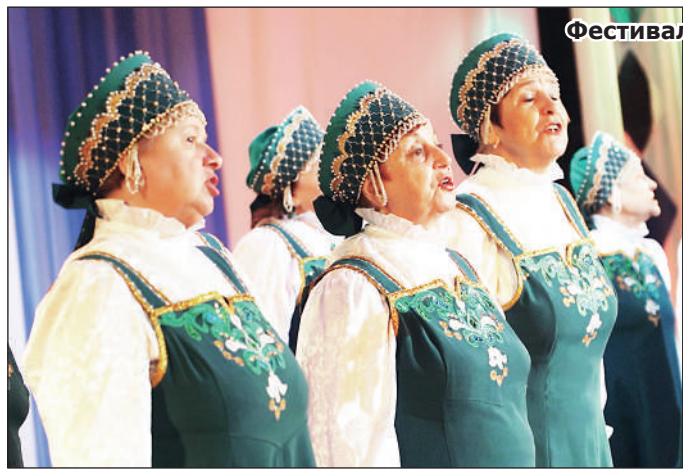
Фестиваль открыли «Прялицы».