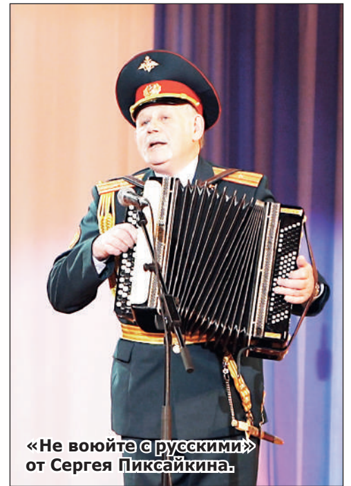
«Не войдите с русскими» от Сергея Пиксайкина.