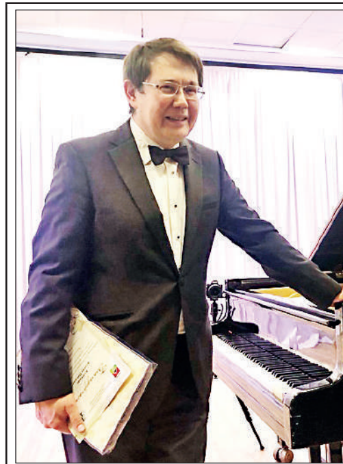
Фото и информация предоставлены ДМШ №24.

На концерты приходят люди разных сфер деятельности; глубина русской музыки позволяет не только насладиться красивым звучанием произведений, но и лучше понять и уважать свою Родину.