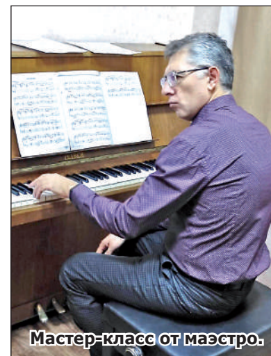
Мастер-класс от маэстро.

Для Максима это тоже не первое выступление в родных пенатах, – он приезжал и с