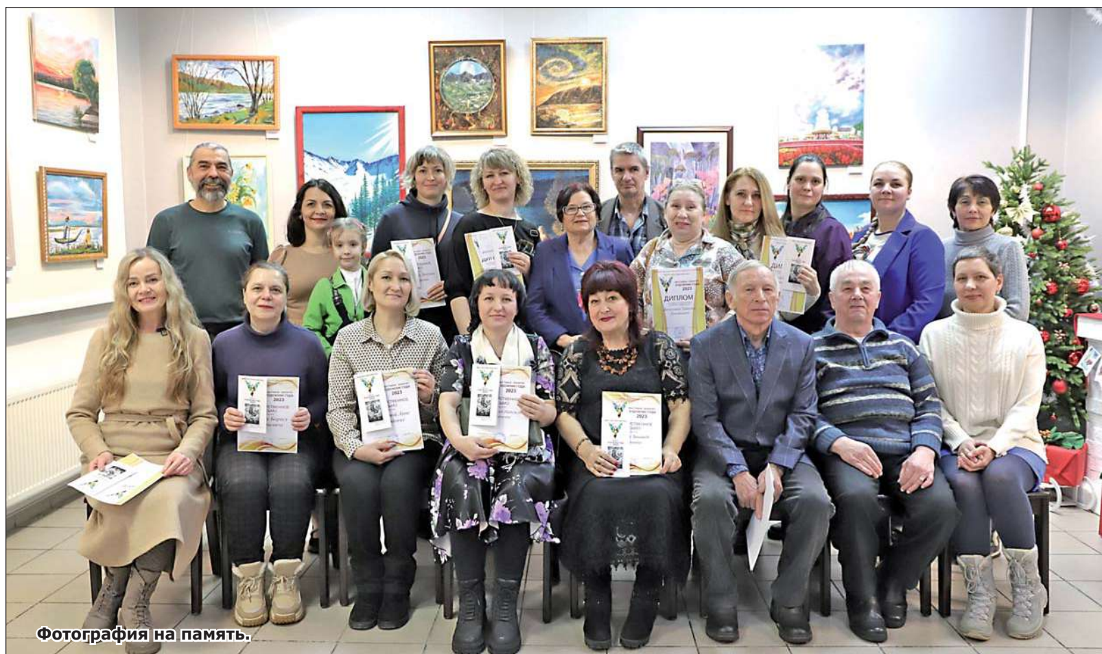
Фотография на память.