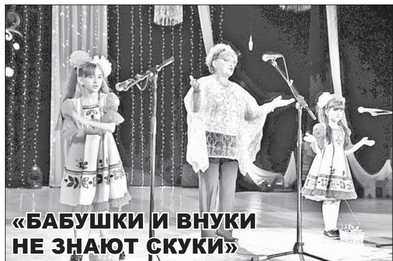
«БАБУШКИ И ВНУКИ НЕ ЗНАЮТ СКУКИ»