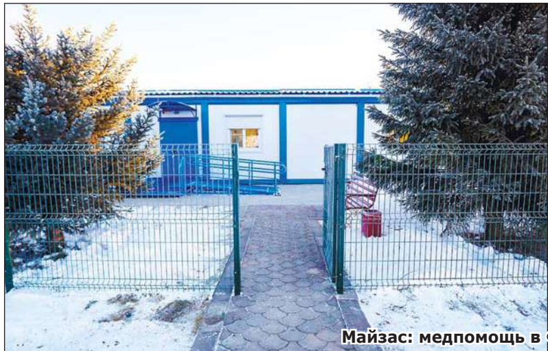
Майзас: медпомощь в ФАПе и на дому

Подготовила Софья ЖУРАВЛЁВА.