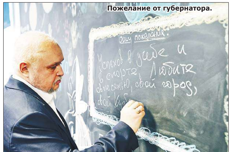
Пожелание от губернатора.

Конференц-зал лицея после ремонта и переоснащения позволяет проводить онлайн-