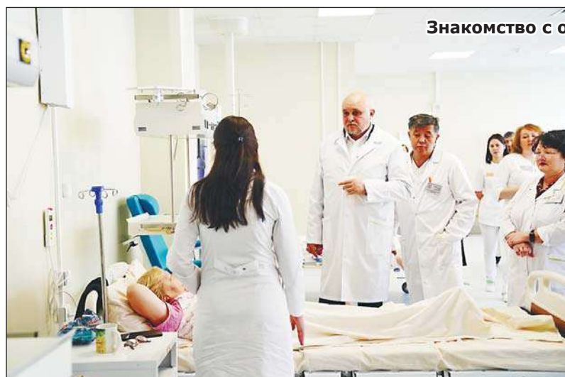
Знакомство с отзывами пациентов.