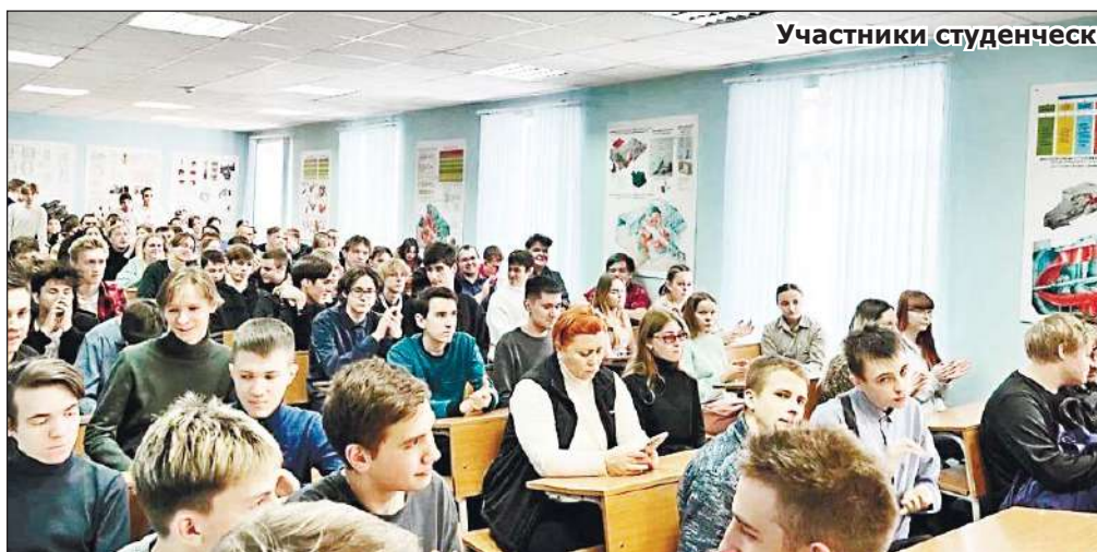
Участники студенческой научной сессии.